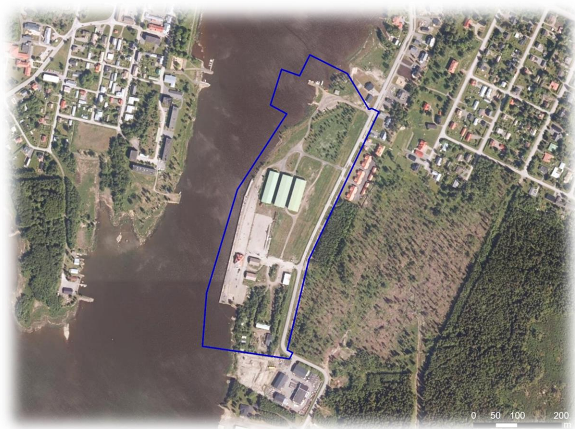
Bild 5. Riktgivande planläggningsområde i förhållande till omgivningens byggnation. Östra sidan av Tjärhovsvägen i höjd med planläggningsområdet har inte ännu förverkligats enligt gällande detaljplan © Lantmäteriverket.