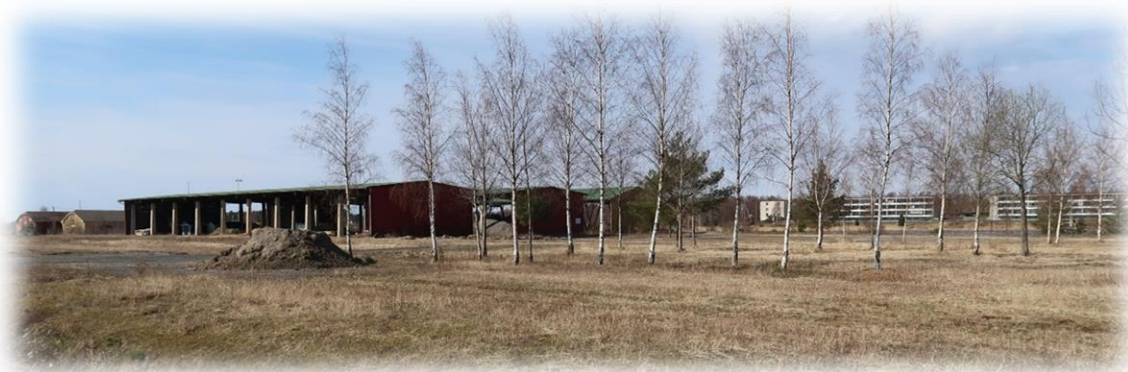
Bild 6. Vy över området från Tjärhovsvägen. I bilden syns de stora under 80-talet uppförda lagerbyggnaderna. I bakgrunden till vänster syns de kulturhistoriskt värdefulla magasinbyggnaderna och till höger våningshus på motsatta stranden.