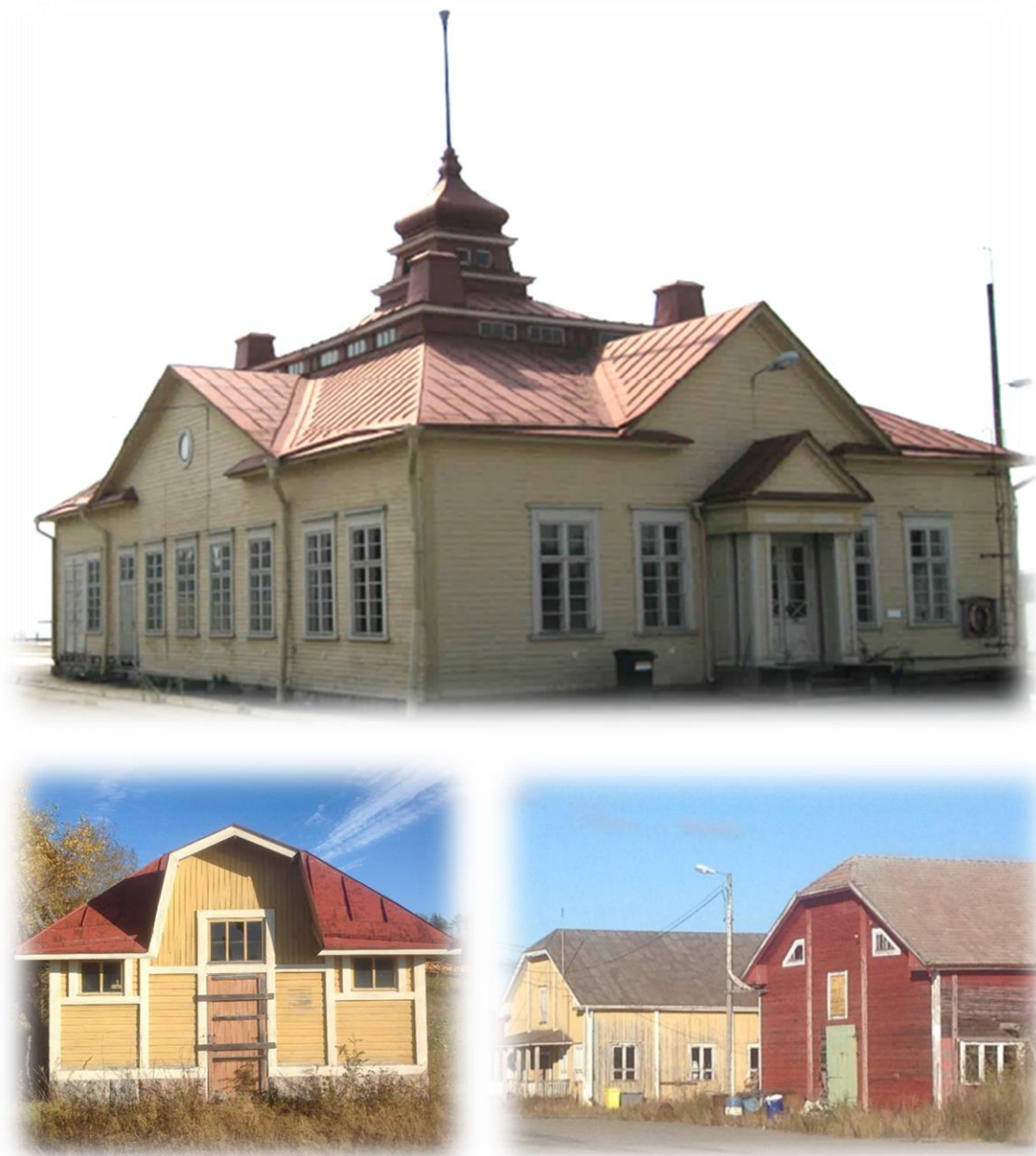
Bild 4. Det gamla hamnkontoret, toalettbyggnaden, samt gamla magasinbyggnader © Vision för Inre hamnen 2016.

I själva planläggningsområdet finns bl.a. det gamla hamnkontoret, Jätkänhovi, en magasinbyggnad och en gammal toalettbyggnad. Området omges av planlagda bostadsområden, rekreationsområden samt industriområden. Närmaste bostad ligger i direkt angränsning till området i öster i form av radhus samt i söder i form av egnahemshus. Havet angränsar i väster.