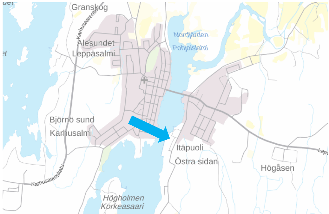
Bild 1. Områdets riktgivande läge anvisat med blå pil © Lantmäteriverket.