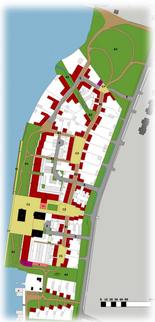
Bild 3. Utdrag ur Vision för Inre hamnen 2016.

Naturvärden förekommer inte inom området.